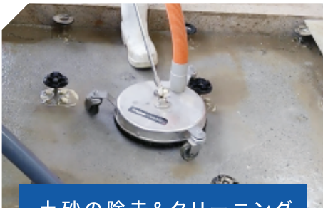
土砂の除去&クリーニング

“水”によって被災した建物室内から水・水分・固形物・におい・細菌・カビ・ウイルスなどを確実に、適切に除去処理をする複合サービスです。