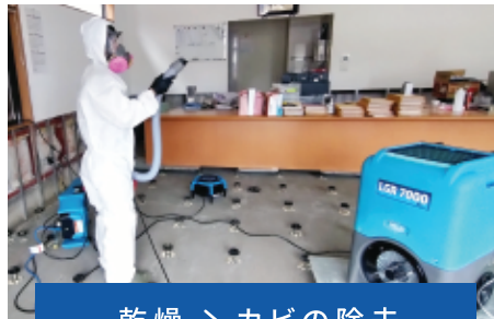
乾燥 > カビの除去